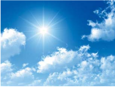
Plate-forme Vent de Raison